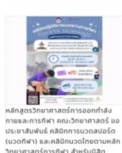
หลักสูตรวิทยาศาสตร์ออกบูธกิจกรรมและกีฬา คณะวิทยาศาสตร์ ขอประชาสัมพันธ์ คลินิกการมองเห็น (แว่นที่ฟ้า) และคลินิกชงโยดามหนักวิทยาศาสตร์การกีฬา สำหรับนิสิตบุคลากร ปักที่ฟ้าและบุคลากรทั่วไป 6 กันยายน 2566