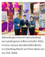
นิสิตหลักสูตรวิทยาศาสตร์บัณฑิตผู้ชนะเลิศการแข่งขันวิทยาศาสตร์ภาคใต้ รับการประเมินและคัดเลือกนิสิตเพื่อนำรางวัลเอ็ดยูเทียร์ มหาวิทยาลัยพะเยา ประจำปี 2566 20 กันยายน 2566