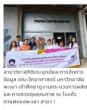
สาขาวิชาสถิติประยุกต์และการจัดการข้อมูล คณะวิทยาศาสตร์ มหาวิทยาลัยพะเยา เข้าศึกษาจากกระบวนการผลิตและการควบคุมคุณภาพ ณ โรงแก้วกาแฟองุ่นพะเยา สาขา 1 7 กันยายน 2566