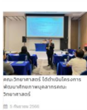
คณะวิทยาศาสตร์ ได้ดำเนินโครงการพัฒนาศักยภาพบุคลากรคณะวิทยาศาสตร์ 5 กันยายน 2566