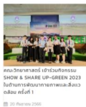
คณะวิทยาศาสตร์ เข้าร่วมกิจกรรม SHOW & SHARE UP-GREEN 2023 ในด้านการพัฒนาภาพและสิ่งแวดล้อม ครั้งที่ 1 20 กันยายน 2566

การดำเนินงานเพื่อเพิ่มประสิทธิภาพในการสื่อสาร คณะวิทยาศาสตร์ได้เผยแพร่ผลงานหรือข้อมูล ที่สาธารณชนควรรับทราบอย่างชัดเจน และจัดให้มีช่องทางการสื่อสารหลากหลาย เข้าถึงง่าย ไม่ซับซ้อน ผ่านทางเว็บไซต์ของ คณะวิทยาศาสตร์