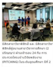
นิสิตสาขาวิชาฟิสิกส์ และ นิสิตสาขาวิชาฟิสิกส์อยู่บนสาขาวิชาการศึกษา (2 บริษัท) ผ่านเข้าร่วม 24 ทีม การประกวดโครงงานวิจัยผลงาน (PITCHING) ในระดับอุดมศึกษา ปีที่ 2 19 กันยายน 2566