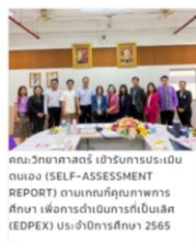
คณะวิทยาศาสตร์ เข้าร่วมการประเมินตนเอง (SELF-ASSESSMENT REPORT) ตามเกณฑ์คุณภาพการศึกษา เพื่อการดำเนินการที่เป็นเลิศ (EDPEX) ประจำปีการศึกษา 2565 20 กันยายน 2566