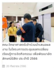
คณะวิทยาศาสตร์เข้าร่วมนำเสนอผลงาน ในโครงการประชุมแลกเปลี่ยนเรียนรู้การวัดกิจกรรม เพื่อพัฒนาอัตลักษณ์นิสิต ประจำปี 2566 20 กันยายน 2566